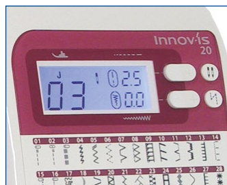
Четкое отображение важной информации на ЖК-дисплее.