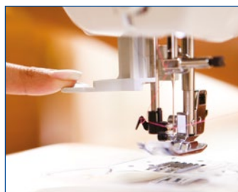
Автоматическая заправка нити.