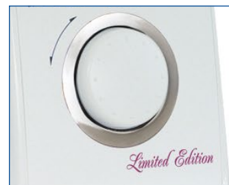
Электронный поворотный переключатель позволяет быстро и просто выбирать необходимые строчки.